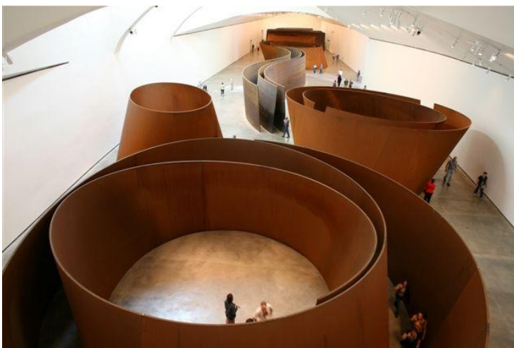
R. Serra: Hmota času

V exteriéru zaujmou kromě samotné budovy další dva objekty: obří pavouk s názvem Maman (Maminka), který je dílem francouzské umělkyně Louise Bourgeois a k jejímuž vytvoření inspirovaly autorku myšlenky na demony z dětství, před nimiž hledala ochranu u maminky, a ohromný "květinový" pes Puppy od Jeffa Koonse (květiny se dvakrát ročně mění), který se stal talismanem muzea.