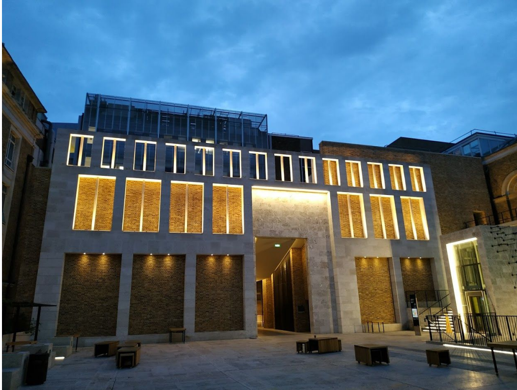
Jedno z vnitřních nádvoří hlavního kampusu UCL