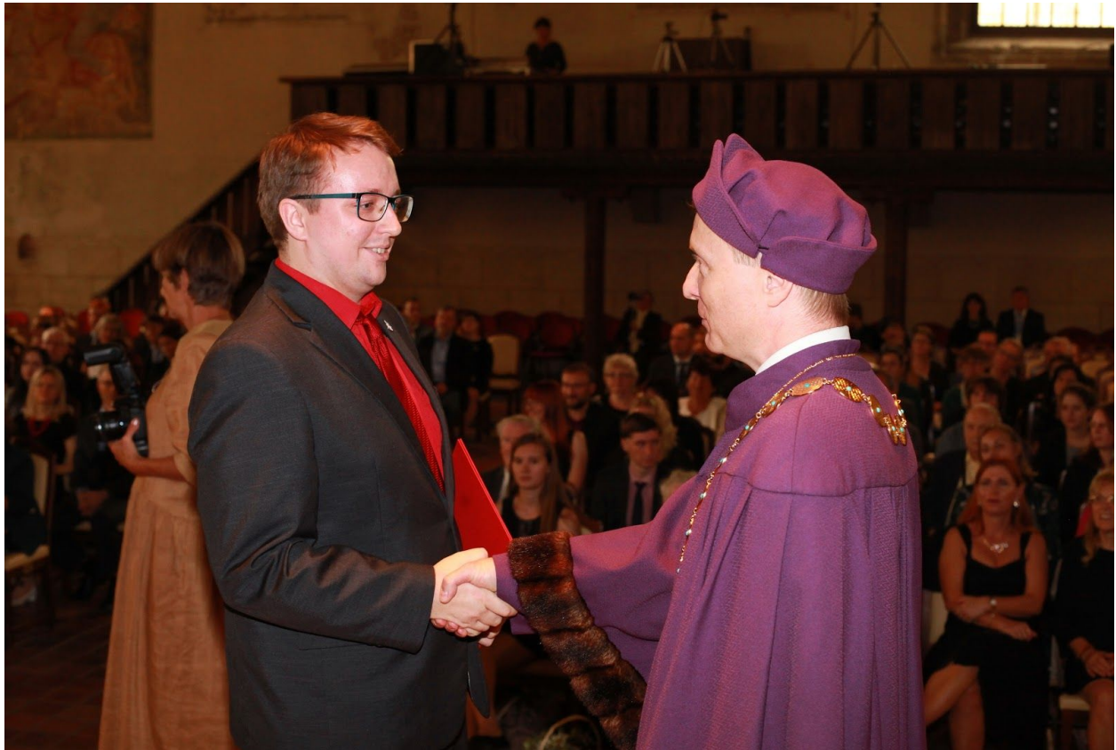
P.S. Nekupujte si fotky z promoce na ČVUTu, nestojí za to.

Za mě musím říct, že kombinace bakaláře na FITu a práce v malé softwarové firmě je nejlepší vzdělání, které do IT můžete získat. V malé softwarové firmě se dotknete všeho, co je třeba, protože nikdo jiný na to nemá čas. Naučíte se jak fungují projekty, jak být nezávislý, jak dotáhnout věci do konce, protože musíte. A k tomu dostane hodně praxe v programování. Na bakaláři se naučíte teorii do detailu, která bude informovat vaše programování, budete psát rychleji rychlejší a lepší programy, lépe navrhnuté do budoucnosti. A to se v IT cení.