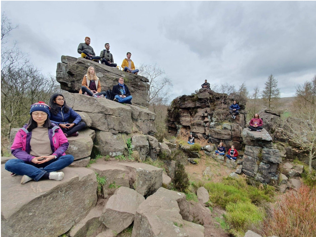
Shaolin Kung Fu na týdenním soustředění

Jeden z obrovských benefitů univerzit v Británii jsou jejich studentské unie. V Česku nějaké jsou, ale přijde mi, že pomalu vlastně jen tak na kolejích. Ale v Británii je studentská unie a spolky v rámci unie velká část studentského života. Na UCL je spolků cca 300. Jsou tam všechny možné sporty a zájmové spolky, od fotbalu přes Harryho Pottera k čokoládě. Já jsem se přidal do dvou: Shaolin Kung-Fu (abych se vůbec nějak hýbal) a Czech and Slovak Society (abych udržel kontakt s domovem). A našel jsem tam úžasné kamarády, hlavně v Kung-Fu, ačkoliv už rok nestuduji, tak stále chodím na tréninky (nyní online) a zúčastňuji se akcí (jako třeba virtuální demo pro prváky: https://www.youtube.com/watch?v=WKhuLvXOCVE ).