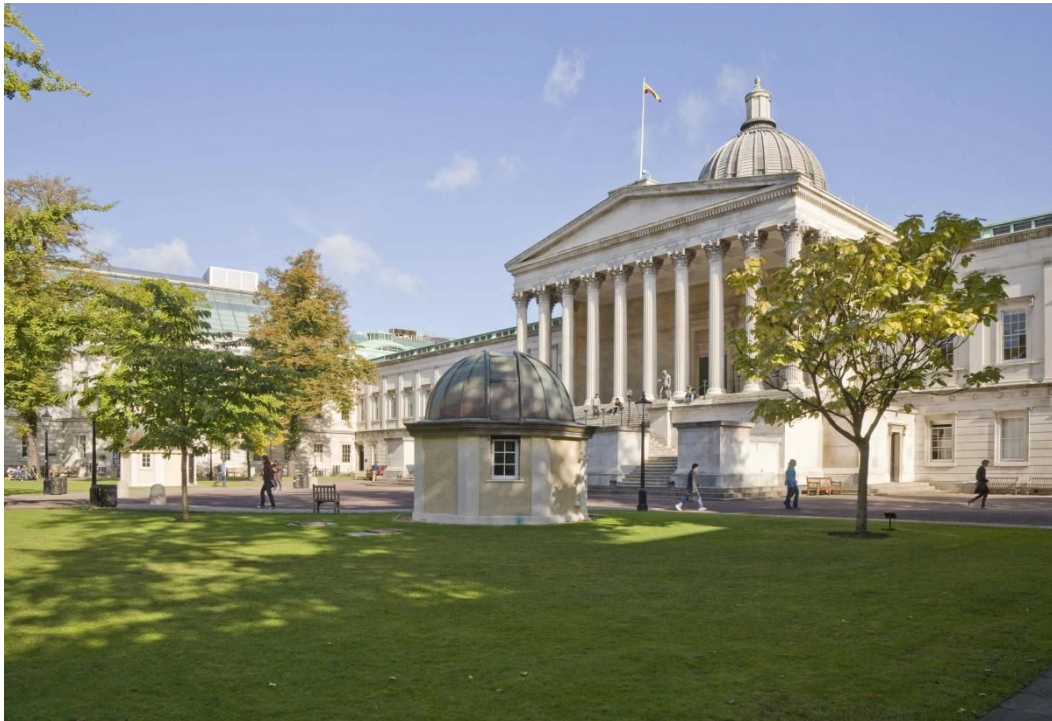
Hlavní nádvoří hlavního kampusu UCL