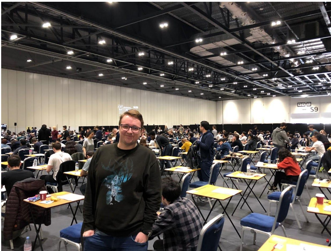
Těsně před jednou ze zkoušek

Na magistru na UCL člověk psal diplomku přes léto, po zkuškovém. To pro mě byl můj oblíbený čas na magistru, protože člověk měl čas se pořádně soustředit, na rozdíl od psaní bakalářky při plném běhu semestru. Hodně studentů přes léto mizí z Londýna (i já byl pár týdnů v Česku), ale já měl dost kamarádů, hlavně z kung-fu se kterými jsem se scházel každý týden i třikrát týdně na trénincích a na pivu v levných barech UCL. (Moje diplomka je dostupná na: https://masters-thesis.mikulaspoul.cz/. )