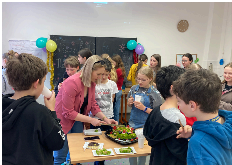
Když má někdo z češtinářů narozeniny, výuka je hned veselejší (květen 2024)