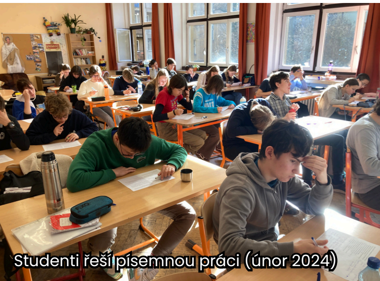
Studenti řeší písemnou práci (únor 2024)

Za všechny tyto činnosti vybíráme následující příklady a jejich fotografické ilustrace: