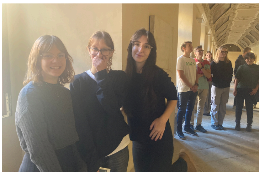
8. A navštívila Národní knihovnu (listopad 2024)