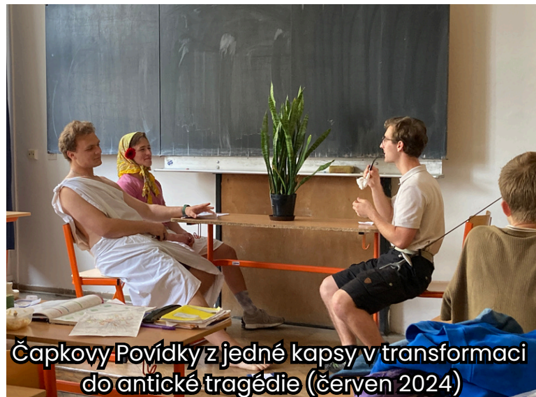
Čapkovy Povídky z jedné kapsy v transformaci do antické tragédie (červen 2024)