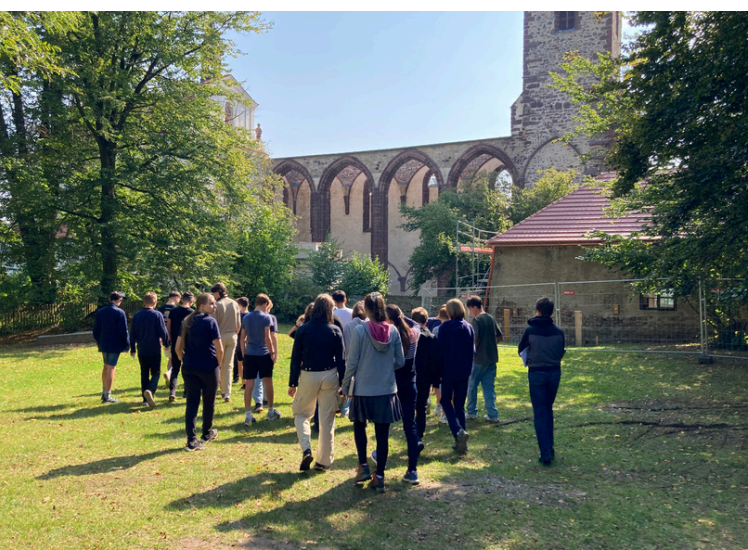
4. A se blíží k Sázavskému klášteru (listopad 2024)