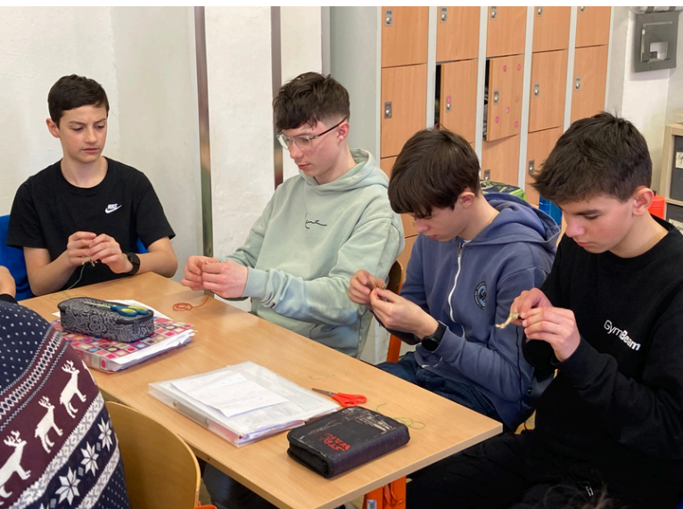
I takhle vypadá výuka češtiny, kluci pletou Tobiáše, literární postavu (duben 2024)