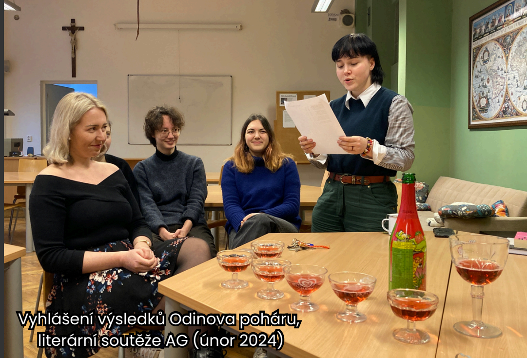
Vyhlášení výsledků Odínova poháru, literární soutěže AG (únor 2024)