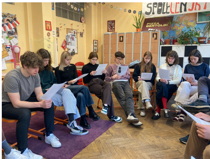
Vzájemně si čteme slohové práce (duben 2024)