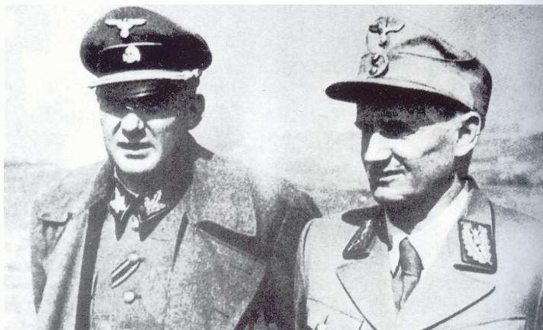
Váleční zločinci plukovník SS Globocnik a gauleiter Rainer měli na svědomí nejen represe proti italským partyzánům ale i podíl na nesnesitelných životních podmínkách odzbrojeného českého vládního vojska