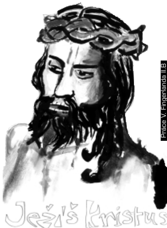
Práce V. Fingerlanda II.B